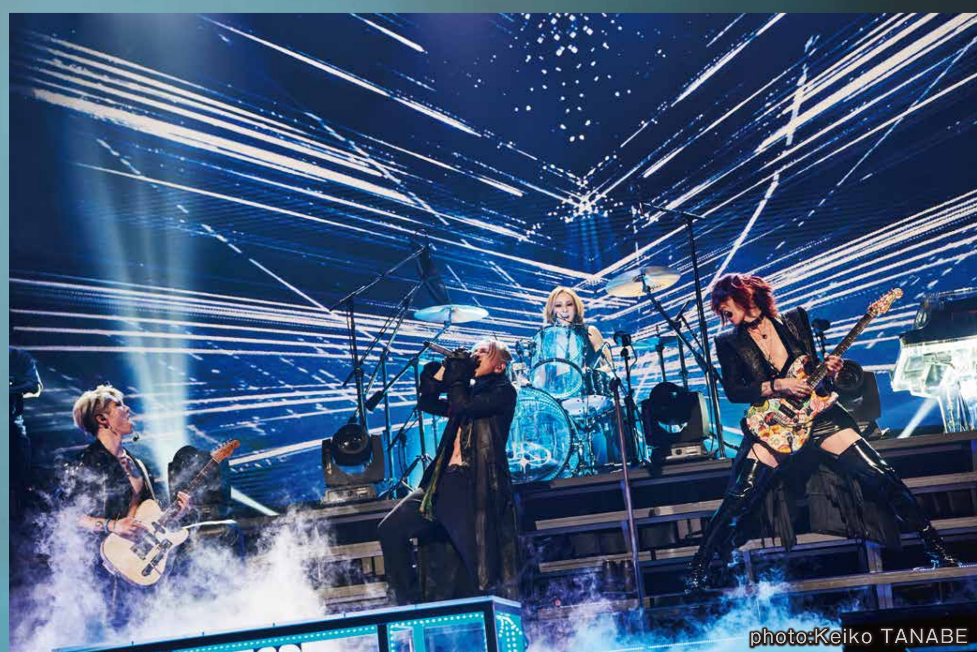
THE LAST ROCKSTARS